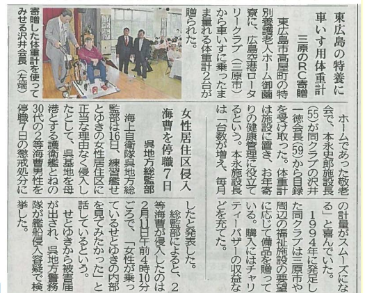
(中国新聞 2014 年 9 月 17 日掲載記事)