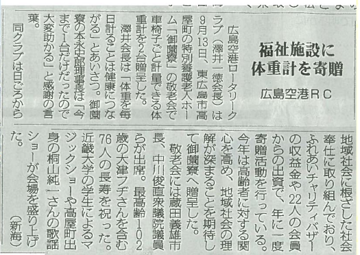
(プレスネット 2014 年 9 月 20 日号掲載記事)