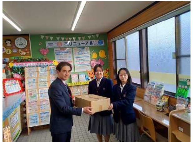
カレンダー発送（高千帆郵便局）

毎年、山陽小野田市社会福祉協議会と協力して、日本の自然を紹介するカレンダーを海外に発送しています。今年は、姉妹校の韓国釜山市の聖母女子高校とオーストラリア モートンベイ市のレッドクリフステート高校に送りました。