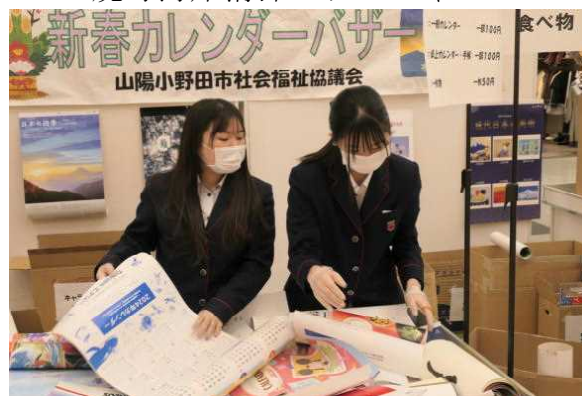
カレンダーバザー

社会福祉協議会に協力して、集まったカレンダーをテーマ（風景・スポーツ等）ごとに仕分けをし、翌日バザーを行いました。