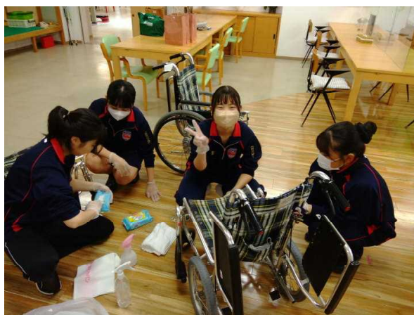
「フクシア紫苑」さんでの車いす清掃

老人ホームの「楠園」さんの訪問はできませんでした。楠園さんには夏冬にお見舞いの色紙を送っています。