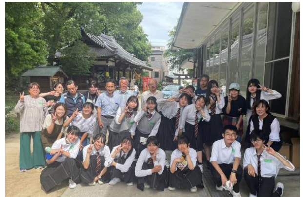
大芝地区社会福祉協議会の方との集合写真