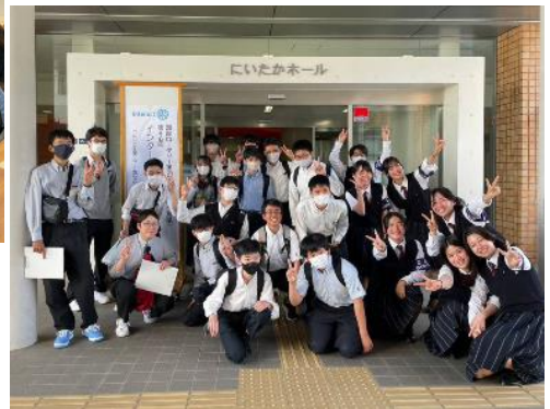
↑ 修道高校とホスト校の如水館高校のインターアクト部