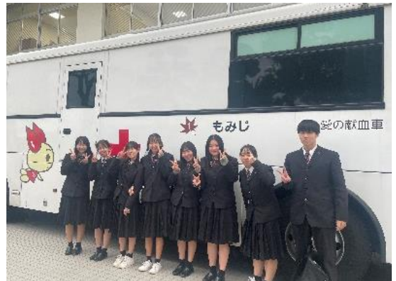
↑ 献血に協力してくれた人に、広島安佐ロータリークラブさんより、プレゼントをいただきました。